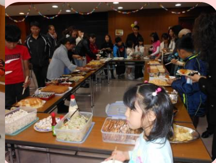
みんなが持ち寄った 南米料理は最高！