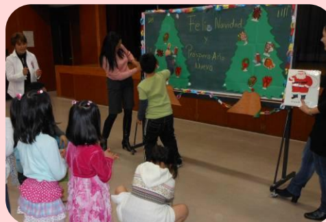
対抗戦ゲームも白熱

でも、この日の子どもたちのお目当ては何といっても「ピニャータ」。参加者がポサダの合唱を始め、会場が一気に盛り上がる中、子どもたちは目隠しをして「ピニャータ」を順番に叩いていきますが、みんないつ割れるかハラハラ・ドキドキ。ついにピニャータは割れて、お菓子を手にした満足そうな子どもたちの笑顔がとても光っていました。