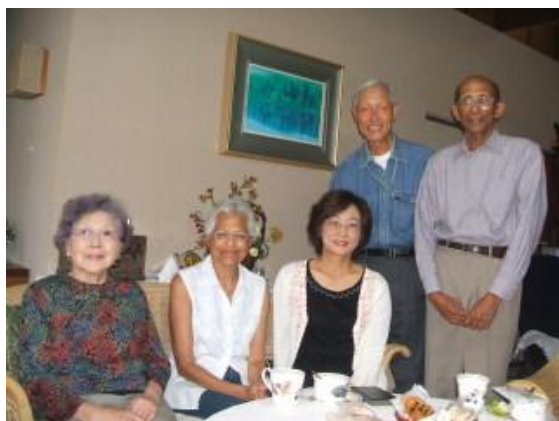
外国人の受入ボランティアとしても活躍中 (右から2番目が筆者)