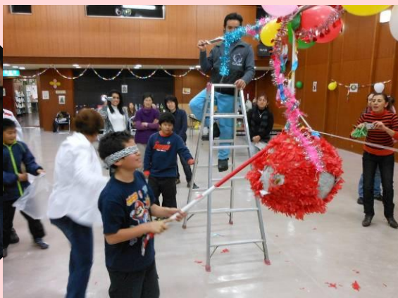
ピニャータ！ 大人も子どもも目が離せません