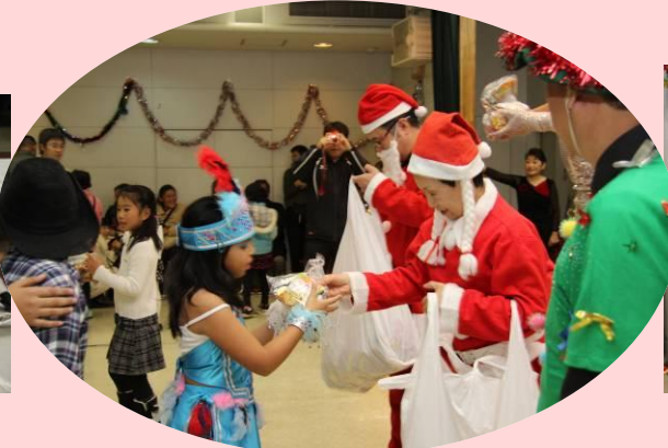
サンタさんから子どもにプレゼント