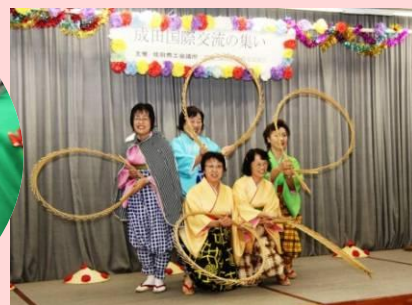
衣装もポーズもバッチリ！ 笑顔の花が咲きました