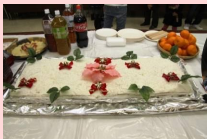
クリスマスケーキも特大サイズ

インドネシア出身の青年と台湾出身の女性による流暢な日本語の司会で始まり、参加者がめいめい持ち寄った料理をみんなで味わいながら思い思いに交流しました。その後次々と自慢の歌や踊りが披露され、観客も拍手と掛け声と一緒に楽しむなど大変盛り上がりました。子どもたちもサンタクロースからのクリスマスプレゼントをもらって大喜び。大人にとっても子どもたちにとっても楽しい一日になりました。