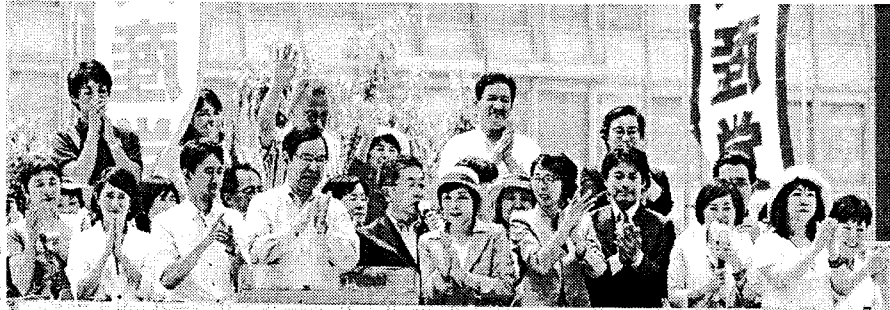
志位委員長、小池書記局長はじめ、19の党議席を獲得した各氏と、東京比例の議員、候補による緊急街頭演説。7月3日、東京・新宿駅西口

日本共産党 大 日本共産党 白 日本共産党 小 日本共産党 志 日本共産党 里 日本共産党 原