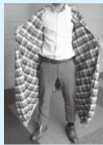
後ろ開きパジャマ