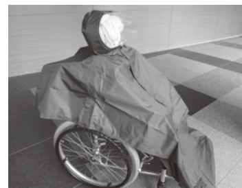
▶車椅子用雨ガッパ

10月9日(日)に行われる「RUN伴+門真」【場所:市民プラザ】にて介護用品等の販売を行いますので、興味を持たれた方・ご相談のある方はぜひお越しください。