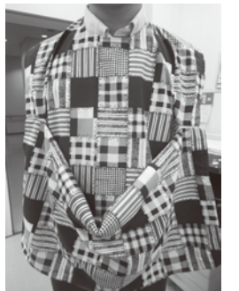
▶前がポケットになる食事用エプロン